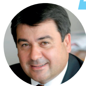
Petar Stefanov, Actual Presidente de CCW

En esta sección especial del Monitor, se presentan los casos de cuatro cooperativas de consumidores: Alleanza 3.0 (Italia), iCoop Korea (República de Corea), NCG/CoMetrics (EE. UU.), JCCU (Japón). Se han elegido estas cuatro cooperativas para destacar algunas de las iniciativas interesantes que han llevado a cabo las cooperativas de consumidores a lo largo del mundo, tanto grandes como pequeñas. Junto con las historias de estas cooperativas se añade una entrevista a Petar Stefanov, el actual presidente de CCW y de la Central Cooperative Union, de Bulgaria.